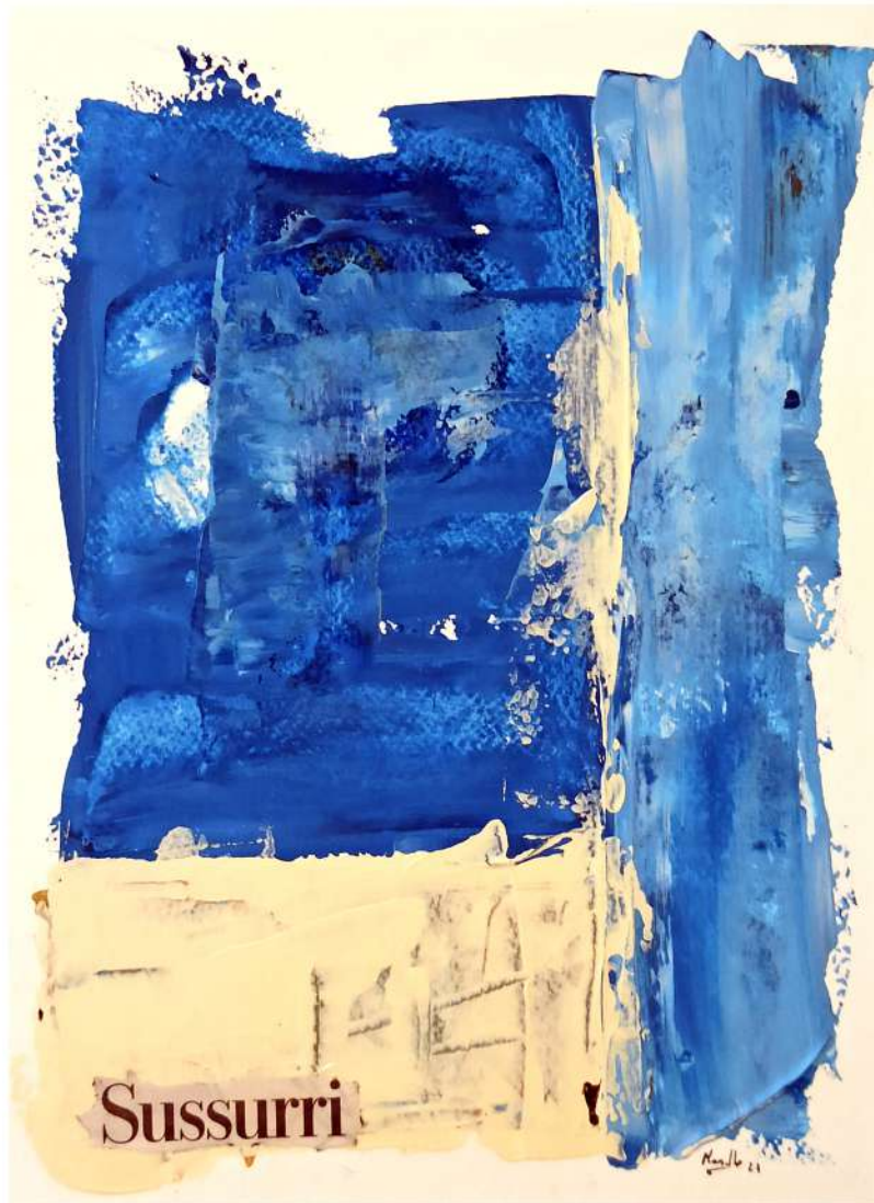
SUSSURRI 2023 Smalti acrilici su carta 40x30 cm