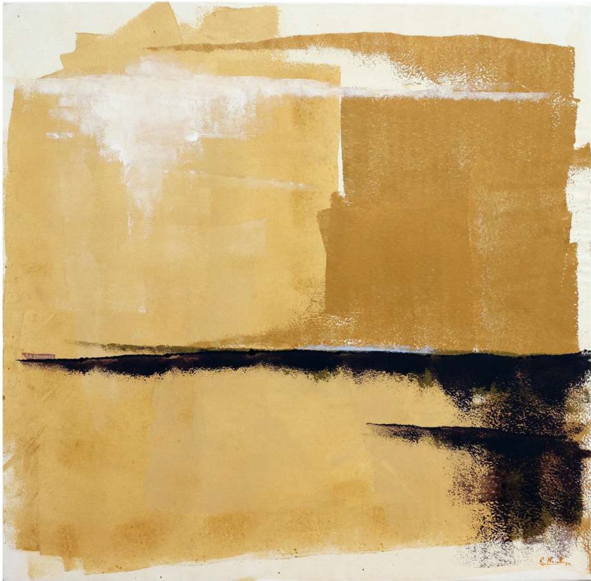
LA GIOVENTÙ 2023 Smalto acrilico su tela 100x100 cm