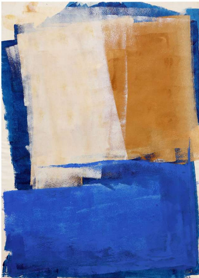
ADESSO 2023 Smalto acrilico su tela 140x100 cm